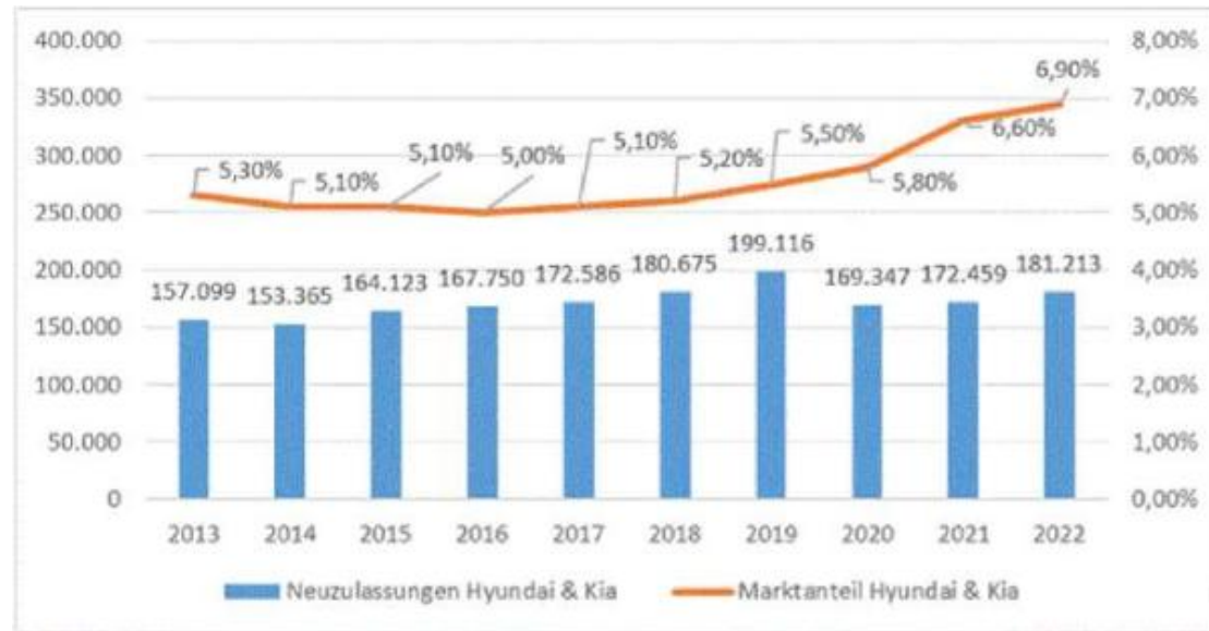
Abb.: Neuzulassungen und Marktanteile von Hyundai und Kia in Deutschland bis 2022